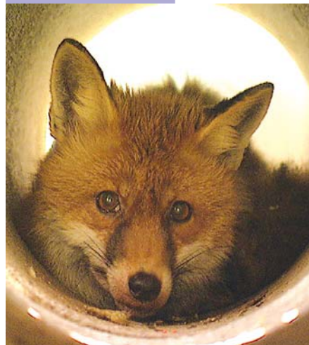
Nicht nur Füchse, sondern auch Haustiere können den Fuchsbandwurm in sich tragen.

Hat man sein Haustier in der Afterregion oder auch an der Schnauze angefasst, dürfen die Hände nicht ungewaschen den Mund berühren. Tierhalter sollten Hund und Katze regelmäßig beim Tierarzt entwurmen lassen. In der Regel wird dem tierischen Freund eine Tablette verabreicht. Die Darmparasiten sterben dann ab und die Produktion von Wurmeiern wird unterbrochen. Lassen Sie sich von Ihrem Tierarzt beraten.