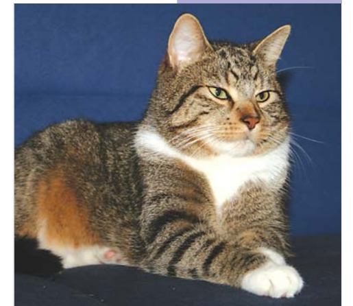
An Putztagen bleibt Kater Elvis lieber auf der Couch.

Jetzt weiß ich, dass ich zukünftig an Putztagen die Couch nicht einen Zentimeter weit verlasse. . .